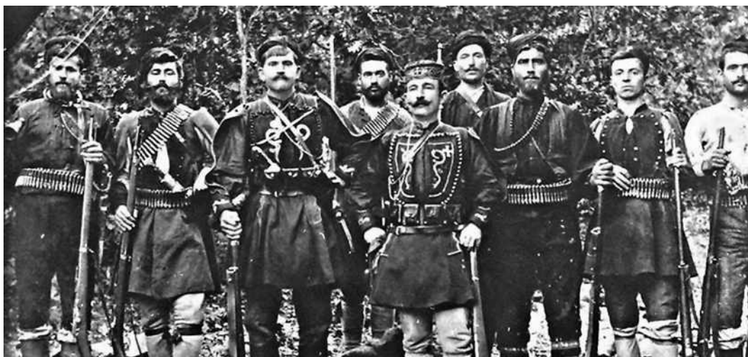
Ο Βάρδας με τούς άντρες του στη Μακεδονία