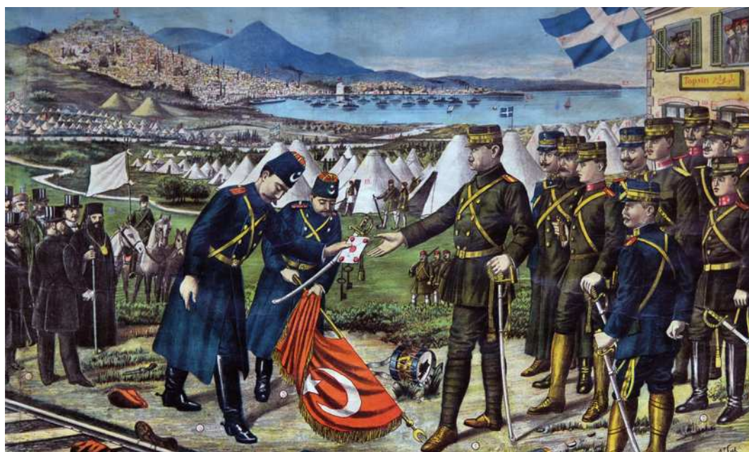
Η παράδοση της Θεσσαλονίκης

«Μακεδονική–Αδριανοπολίτικη Έσωτερική Έπαναστατική Όργάνωση» με ηγέτη τόν Γκότσε Ντέλτσεφ, ένα Βούλγαρο επηρεασμένο από τις ιδέες του Μάρξ και του Μπακούνιν. Μετά τὸ θάνατό του (Μάιος 1903), ὀργανώθηκε ἡ ἐξέγερση τοῦ Ἰλιντεν στὴ Δυτ. Μακεδονία (Ἰούλιος 1903) μὲ πρῶτο στόχο τὴν αὐτονομία της καὶ στὴ συνέχεια τὴν ἐνσωμάτωσή της στὴ Βουλγαρία.