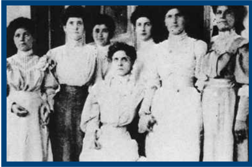
Οι Έλληνίδες δασκάλες τής Μακεδονίας συνέβαλαν τά μέγιστα στήν Έθνική διάπλαση τών έλληνοπαίδων στά χρόνια τής προετοιμασίας του Μακεδονικού Άγώνα.