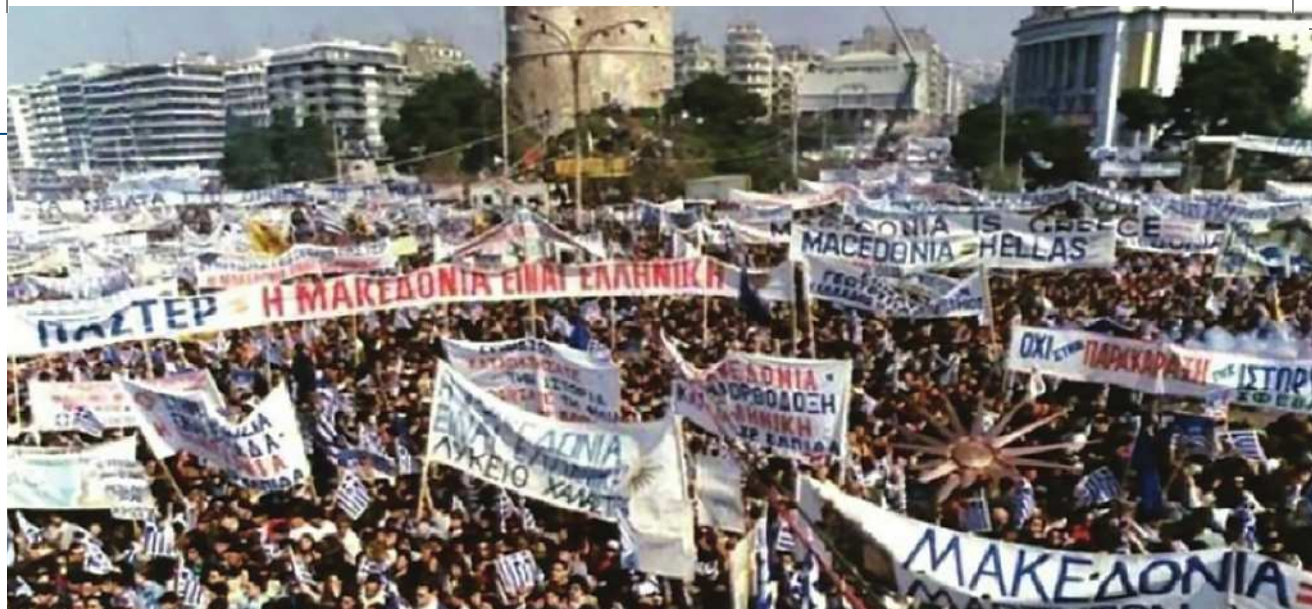
Συλλαλητήριο στην Θεσσαλονίκη 1992.

υπό την αιγίδα του ΟΗΕ. Από πλευράς ΕΕ, τὸ Εὐρωπαϊκὸ Συμβούλιο τοῦ Ἰουνίου 2008, με ὁμόφωνη ἀπόφασή του, ἀποφάσισε ὅτι ἡ λύση τοῦ ζητήματος τοῦ ὀνόματος κατὰ τρόπο ἀμοιβαίως ἀποδεκτὸ ἀποτελεῖ θεμελιώδη ἀναγκαιότητα προκειμένου νὰ γίνουν περαιτέρω βήματα στὴν ἐνταξιακὴ πορεία τῆς ΠΓΔΜ πρὸς τὴν Ε.Ε.