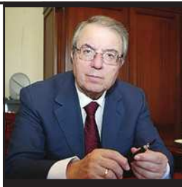
ΜΠΑΜΠΙΝΙΩΤΗΣ ΓΕΩΡΓΙΟΣ ΓΛΩΣΣΟΛΟΓΟΣ