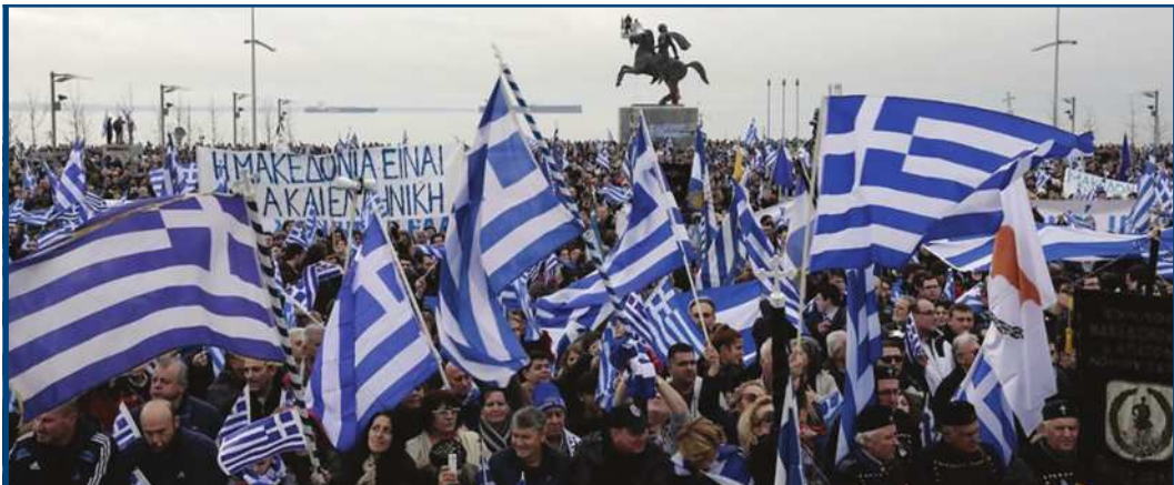
Συλλαλητήριο στην Θεσσαλονίκη 2017

είναι σαν να ανοίγουμε τους ασκούς του Αιόλου. Όφειλουμε να έπαυρπνούμε για την διαφύλαξη της έθνικής μας άκεραιότητας, δεδομένου ότι υπάρχουν ισχυρές διεθνείς δυνάμεις που έχουν στόχο τους στην σαλαμοποίηση της περιοχής των Βαλκανίων. Η περίπτωση της Γιουγκοσλαβίας είναι νωπή. Το επόμενο θύμα θα είναι ή χώρα μας. Τα μαύρα σύννεφα που μάς άπειλούν γίνονται κάθε μέρα και περισσότερο όρατά. Εάν υποχωρήσουμε τώρα στην άνοιχτή πρόκληση των Σκοπίων που χωρίς να έχουν παραιτηθεί από τον κύριο στόχο της έθνικής τους πολιτικής έπιδιώκουν σήμερα να γίνουν μέλος του NATO με την ψήφο τή δική μας για να μπορούν αύριο – μεθαύριο να μάς άπειλούν από μιá θέση ύψηλότερη και ισχυρότερη, τότε θα είμαστε άξιοι τής Μοίρας μας.